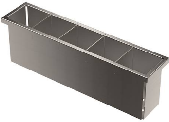
Perforierte Edelstahlwanne 8151 004