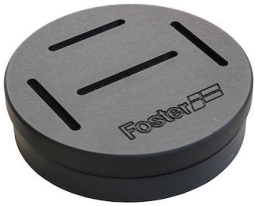
Messerständer 8100 030